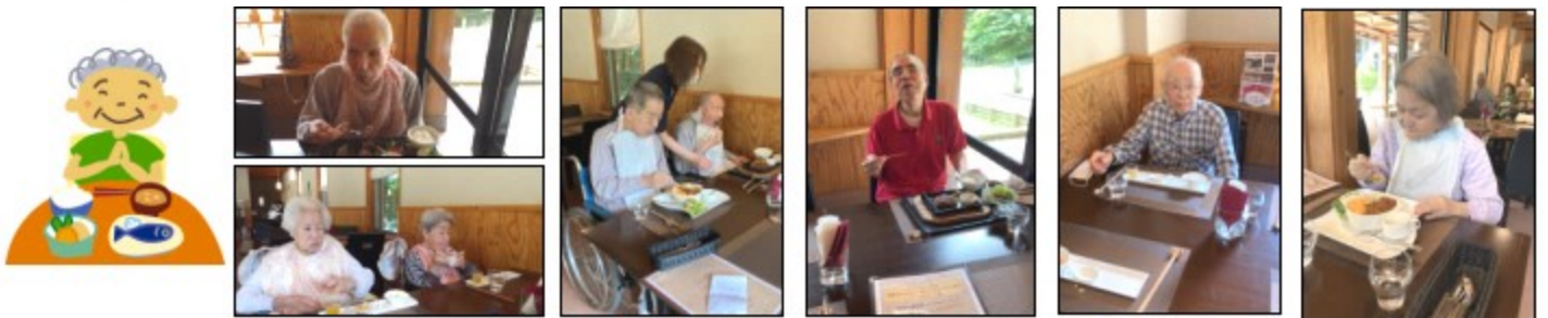
外食会 誕生月の方を中心に近くのレストラン『SAKA』へ昼食を食べに行きました。