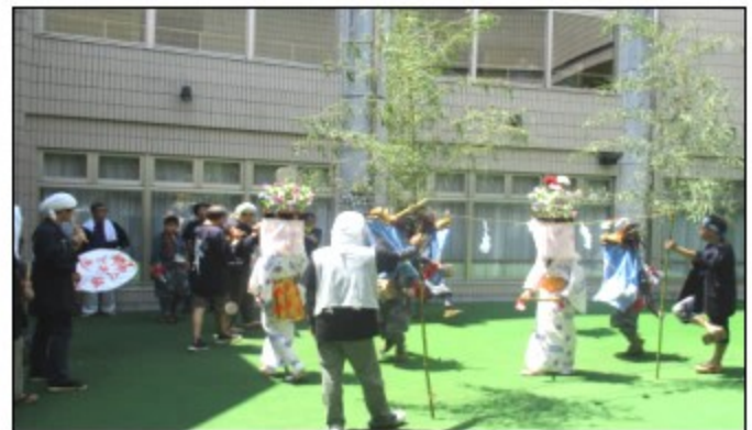
地元の「下中組獅子舞」の方々に施設の中庭で舞を披露して頂きました。