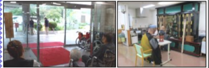
7月13日 盆供養法要・迎え火 7月16日 送り火

夏の体験ボランティア 夏休みを利用して、奥多摩町の小学8年生1名が体験ボランティアに来てくれました。 利用者とのオセロ対決やおしぼりたため、食事介助を行いました。