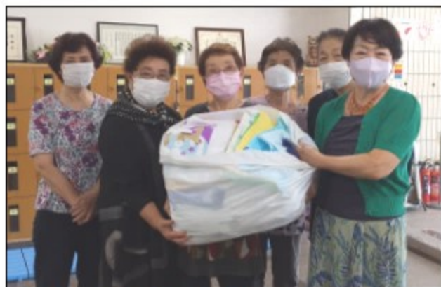
『奥多摩町高齢者クラブ連合会 女性部』よりタオルの寄付を頂戴しました。この場を借りて御礼申し上げます。