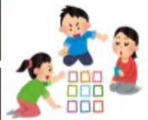
8月14日 カルタ大会 昔の演歌や歌謡曲のカルタのため職員より利用者の方がよく取れました。