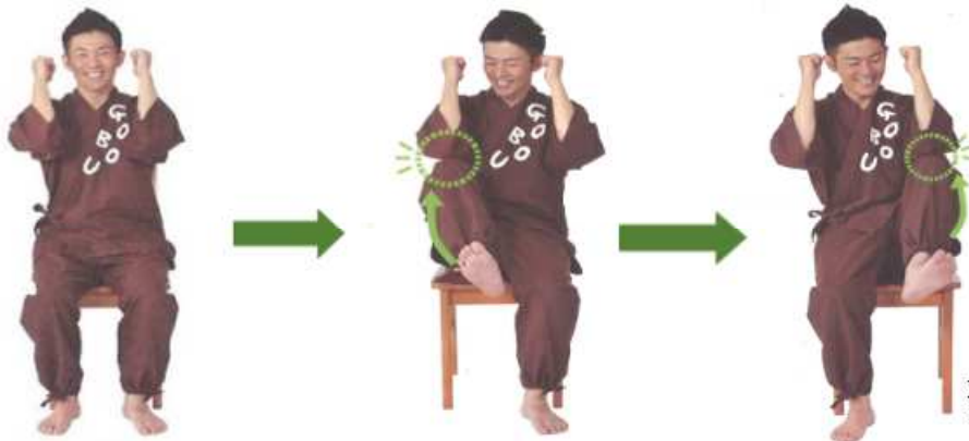
両手をガッツポーズにします。

リハビリでは、利用者の皆様に元気で過ごして頂ける様に簡単な体操を取り入れています。今日はリハビリでも行っているごぼう先生の「テクテク体操(一部抜粋)」をご紹介します。無理せずコツコツ積み重ねることが予防・未病につながります。運動は頑張らなくても大丈夫！小さなことから楽しんでコツコツ元気に過ごしましょう。