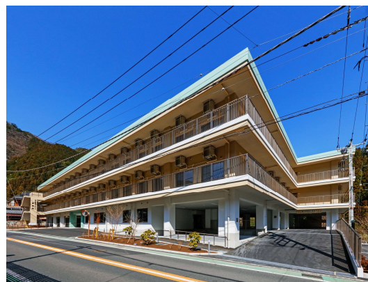
写真 介護老人福祉施設 琴清苑